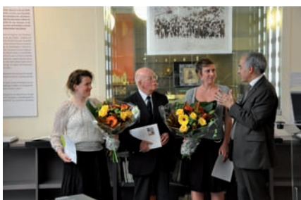
Cérémonie de remise du Prix AUBERTIN 2010