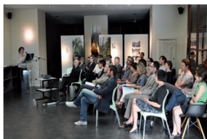
La lauréate présente ses recherches